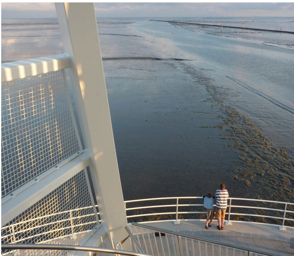
Duitse Wadden, jachthaven Juist

In het begin van 2021 zal hopelijk de Toogdag gehouden kunnen worden. Deze dag organiseert het OBW samen met het Waddenfonds. Centraal staat daarin hoe de Agenda voor het Waddengebied wordt uitgevoerd, welke prioriteiten van de Investeringsagenda zijn gekozen en hoe de ervaringen tot nu toe zijn met de (bestuurlijke) samenwerking zoals de Beheerautoriteit, het Omgevingsberaad en het Bestuurlijk Overleg.