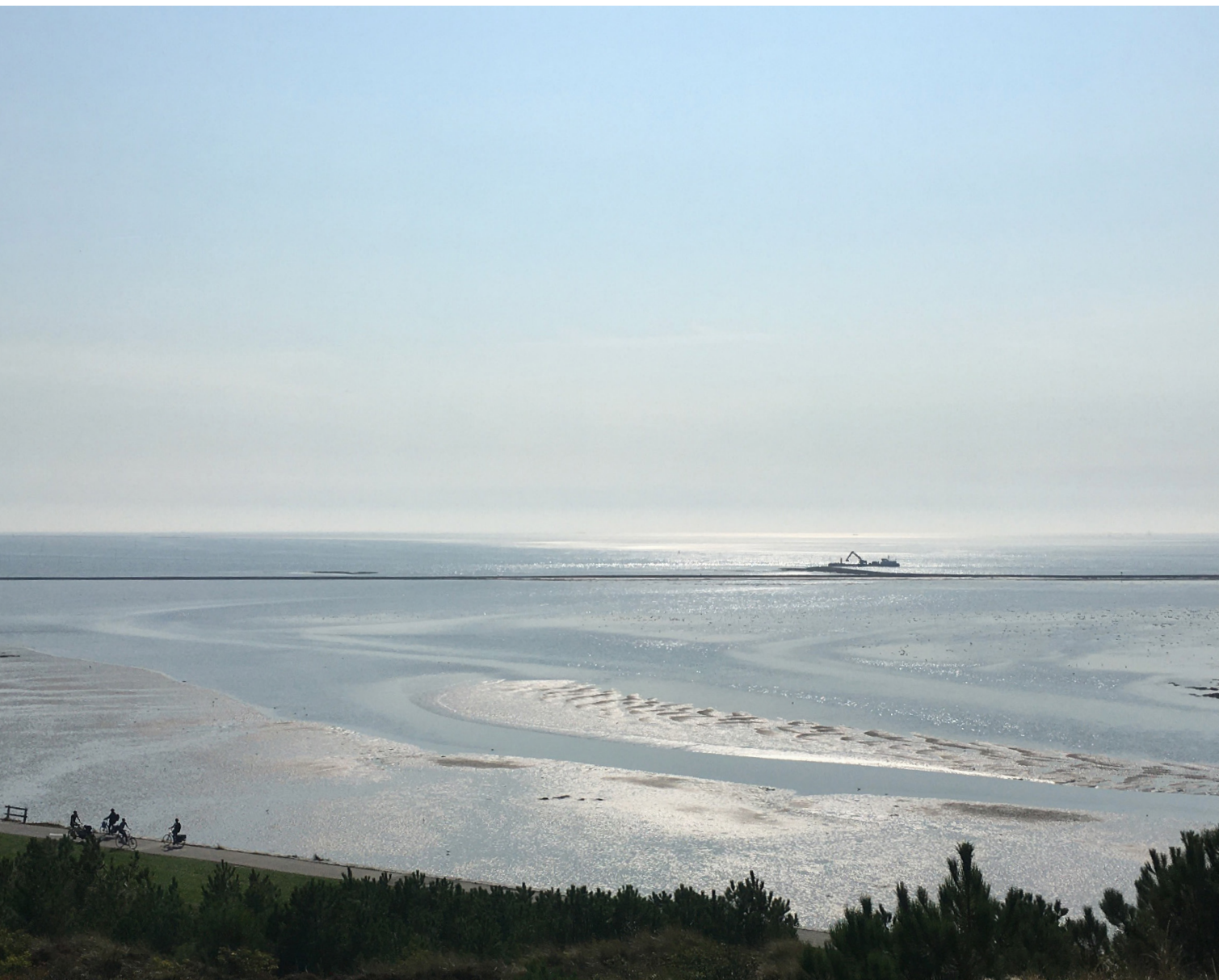
Terschelling, de Dellewal