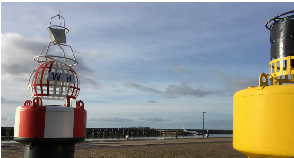
Harlingen, Nieuwe Willemskade

Bij de jaarrekening van 2020, gereed in mei 2021, is er mogelijk meer inzicht in de begroting van het jaar 2021. Dit kan misschien een reden zijn voor aanpassing van de begroting 2021, alhoewel dit in principe niet wenselijk is.